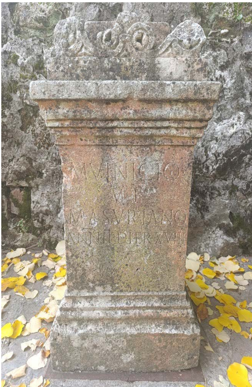
Slika 1. Nadgrobní spomenik u obliku kultnog žrtvenika dvogodišnjeg dječaka Masurijana