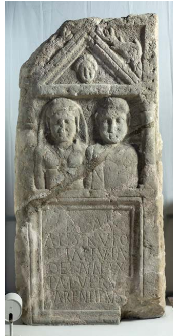
Slika 6. Stela iz Ostrošča bračnog para sa prikazom ženske autohtone odjeće