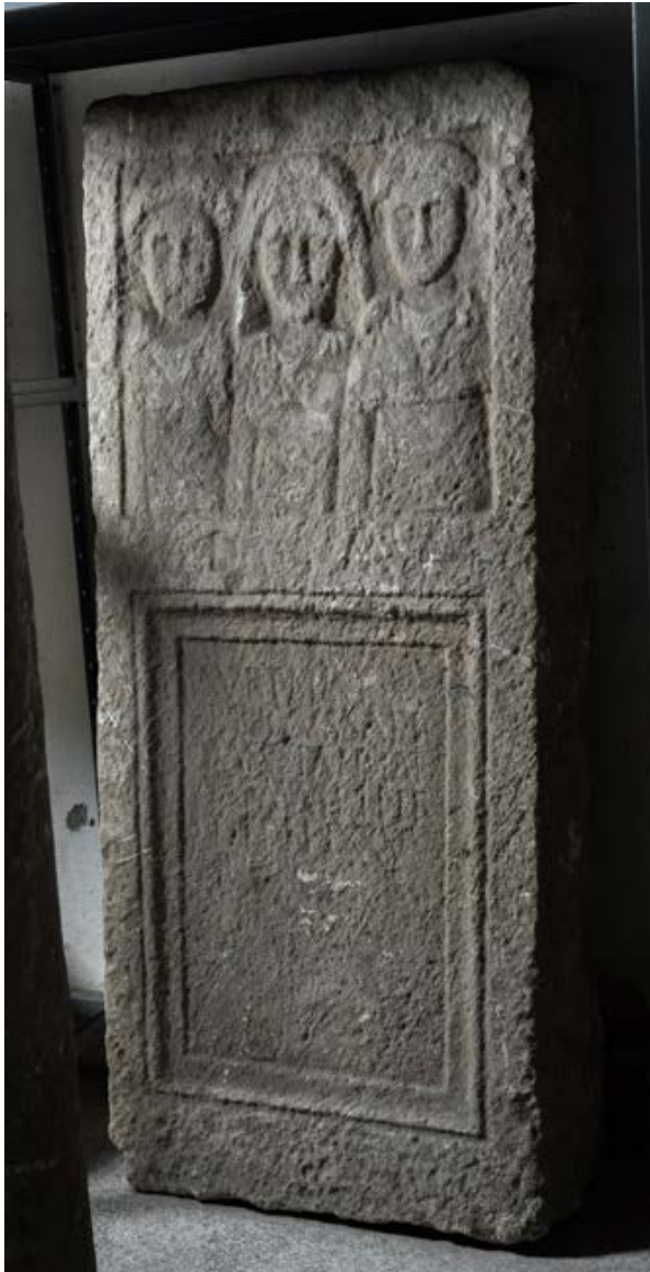
Slika 7. Nadgrobnni spomenik majke sa dvoje odrasle djece iz Radešina kod Konjica

prikazane u tradicionalnoj nošnji ove žene bi mogle pripadati lokalnim elitama jer je izrada ovakvih spomenika bila dosta skupa. Zanimljivo je da se na spomeniku iz Konjica sa majčine lijeve i desne strane nalaze portreti njene odrasle djece, ali bez muža. Teško da možemo govoriti o samohranjoj majci jer je umrla sa 70 godina, ali, po svemu sudeći, njena kći nije udata, već zajedno sa bratom podiže spomenik.