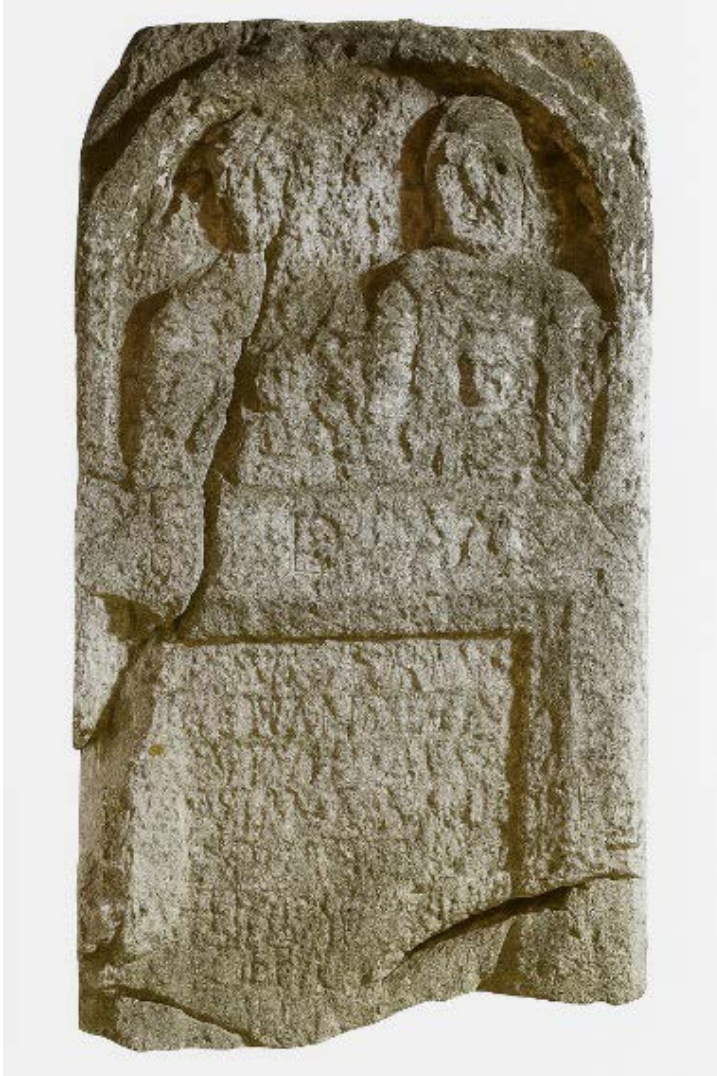
Slika 4. Nadgrobní spomenik djevojčice Meke i dječaka Maksimina

vidjeti težnju da se prikaže jedna kompaktna porodica. Spomenik je specifičan u društvenom kontekstu. Naime, zanimljivo je to što članovi jedne porodice imaju onomastiku koja pripada dvjema različitim imenskim korpusima. Dok otac i sin imaju rimska imena, majka i kći imaju keltska imena Mandeta i Maca. 59 Može se pretpostaviti da je otac boravio u nekoj od provincija gdje žive Kelti kao vojnik te da je nakon završetka vojne službe svoju suprugu doveo u dolinu Neretve. Svoj identitet Mandeta je manifestovala kroz nadijevanje imena svojoj kćerki.