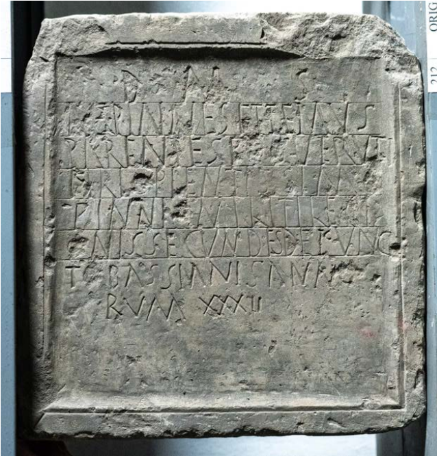
Slika 5. Nadgrobni spomenik vojnika Pinesa

društvenu ulogu. Dok su muškarci mogli postići status i položaj u društvu na više načina, uključujući razne počasti i javne službe, žene su mogle koristiti samo ograničena sredstva za izgradnju društvene ličnosti, a odjeća je bila jedno od najvažnijih među njima. 70