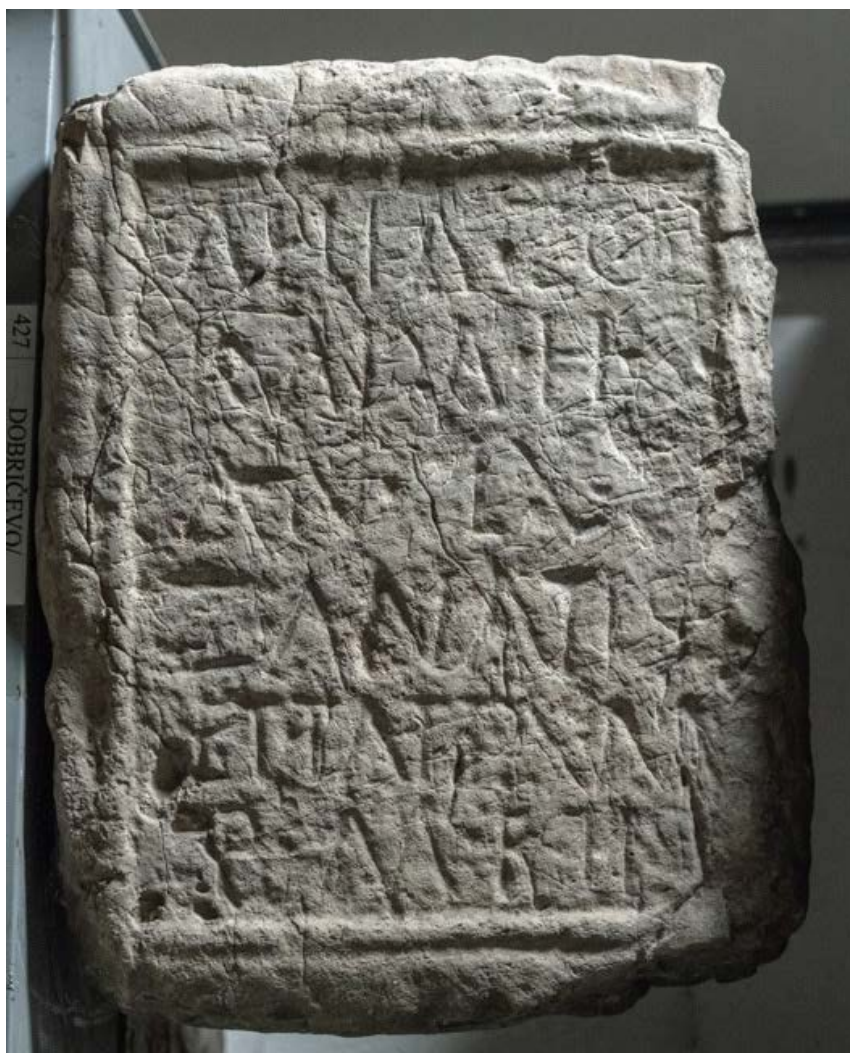
Slika 9. Nadgrobni spomenik Elije Zorade iz Dobričeva kod Bileće