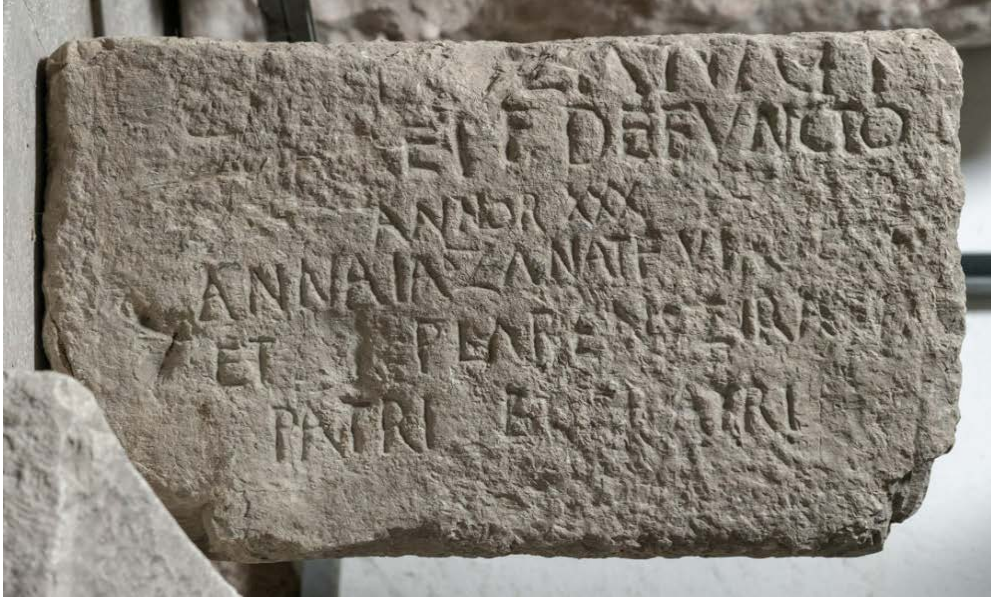
Slika 8. Nadgrobni spomenik iz Ljubomira koji ocu i bratu podiže Annaia. Sva imena na spomeniku su autohtona

novim rimskim običajima. Sličan primjer imamo iz Dobričeva kod Bileće gdje su Zanatis i Tatta podigli spomenik Eliji Zoradi ( Aelia Zorada ), koja je preminula u dobi od 60 godina (Sl. 9). 77 U antičkom periodu 60 godina je označavalo duboku starost.