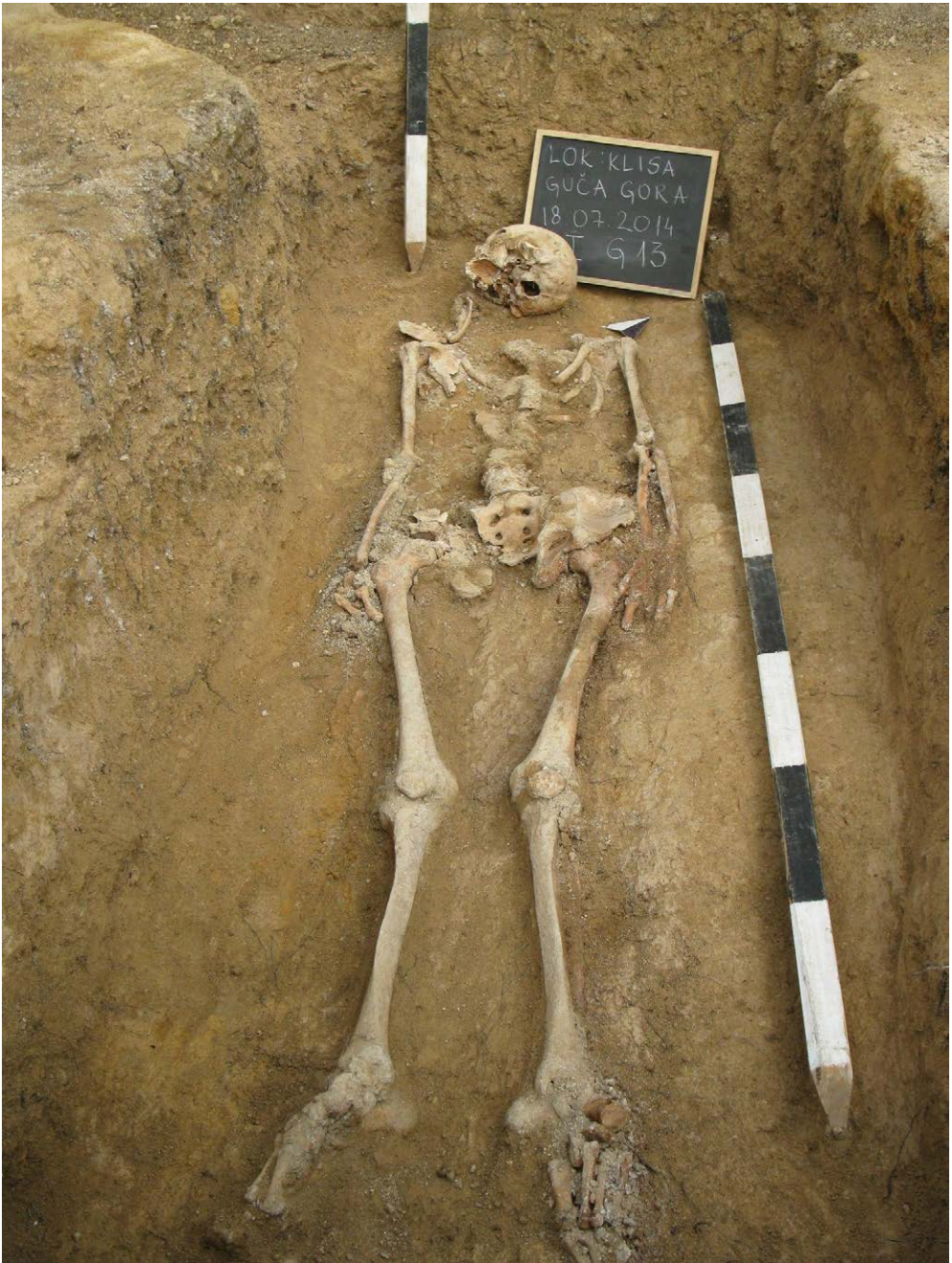
Slika 1. Primjer ukopa sa lokaliteta u Gučoj Gori