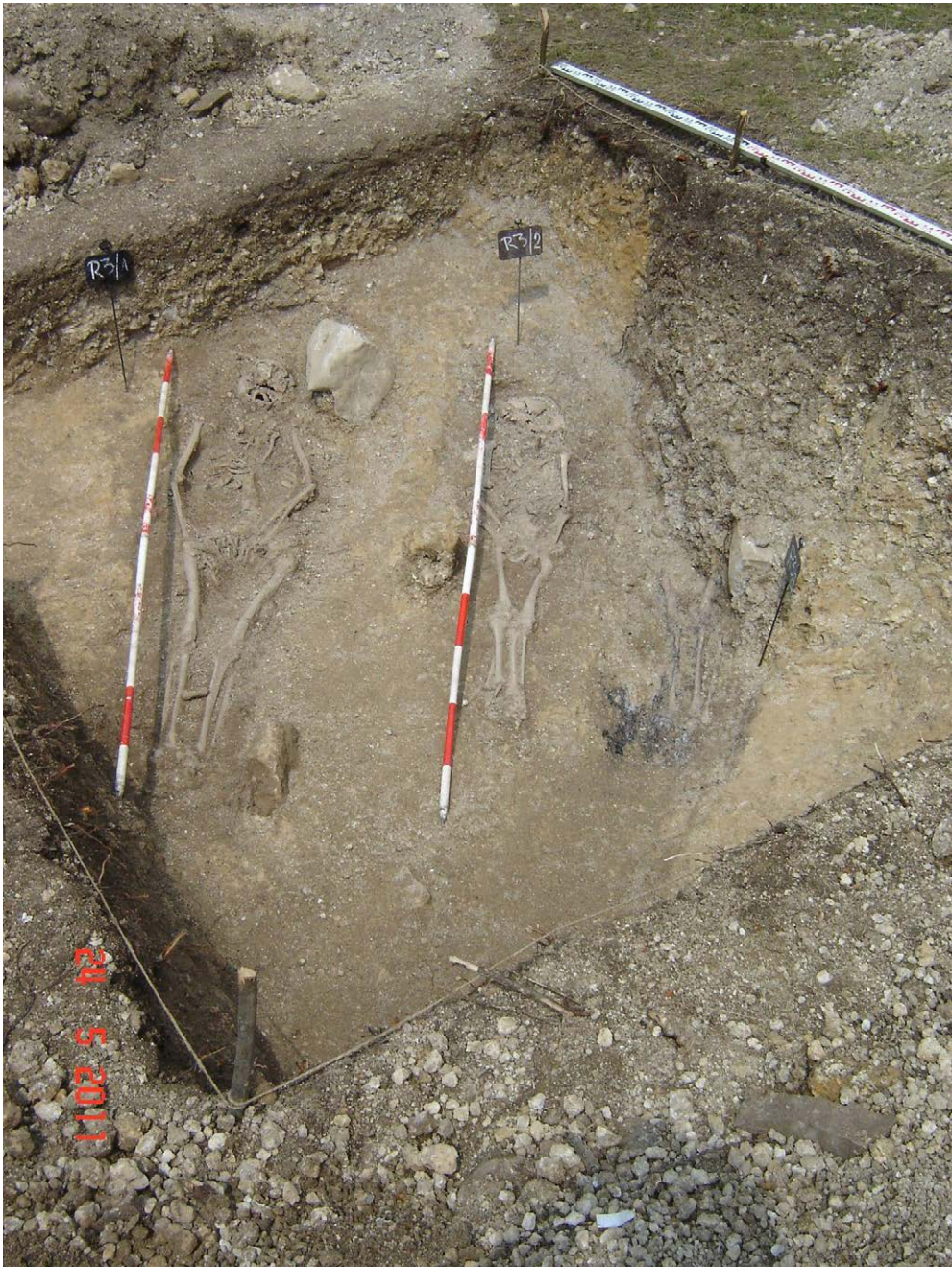
Slika 6. Mašeta u Fazlćima prilikom istraživanja 2011. godine