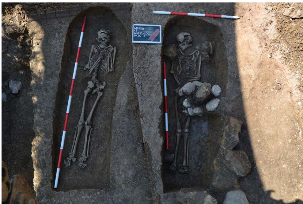
Slika 12. Arnautovići 2018 – grobovi 4 i 5

Institut za arheološka istraživanja Filozofskog fakulteta Univerziteta u Sarajevu, u suradnji sa Zavičajnim muzejem Visoko, proveo je u julu 2018. godine manja zaštitna iskopavanja na lokalitetu Arnautovići kod Visokog, na prostoru predviđenom za izgradnju cestovne infrastrukture. Riječ je o grobovima koji su se nalazili u neposrednoj blizini krunidbene i grobne crkve bosanskih kraljeva, odnosno bili u sastavu velikog groblja koje se pružalo svuda okolo objekta. Intervencija je bila hitna, s obzirom na to da su građevinski radovi već rezultirali oštećenjem dijela lokaliteta, uključujući i Grob br. 1. Iskopavanjima je obuhvaćeno pet grobnih cjelina. 27