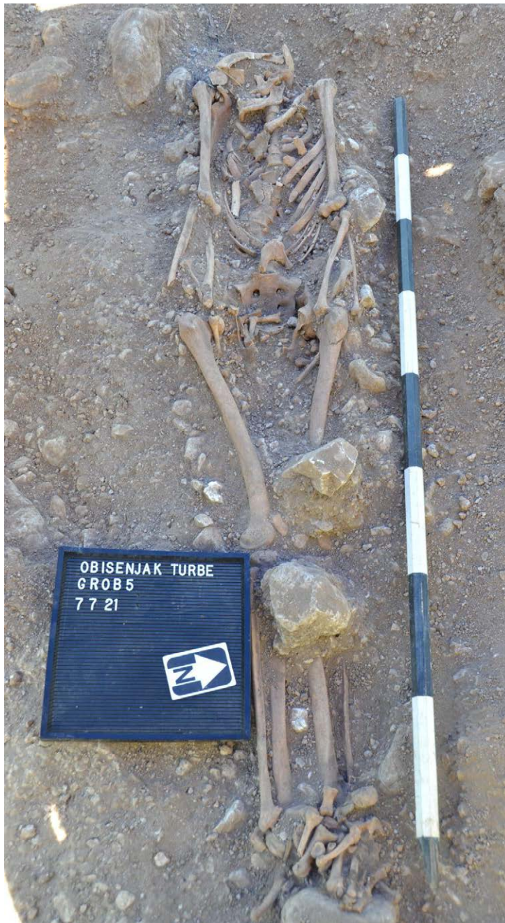
Slika 4. Grob br. 5 - Obišenjak kod Turbeta