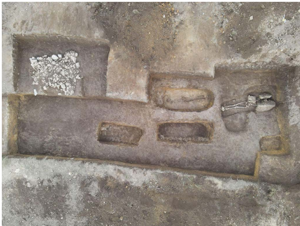
Slika 9. Sonda 4 na Metaljici prilikom istraživanja 2020. godine

Arheološka istraživanja na Metaljici provedena su u sklopu projekta Genetičke karakteristike stanovnika srednjovjekovne Bosne , čiji je nosilac Institut za genetički inženjering i biotehnologije (INGEB). Iskopavanja su obavljena u tri faze u kampanjama od po deset radnih dana: 2019, 2020. i 2023. godine.