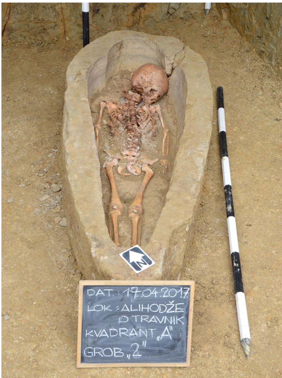
Slika 2. Dječiji sarkofag sa lokaliteta Gajani