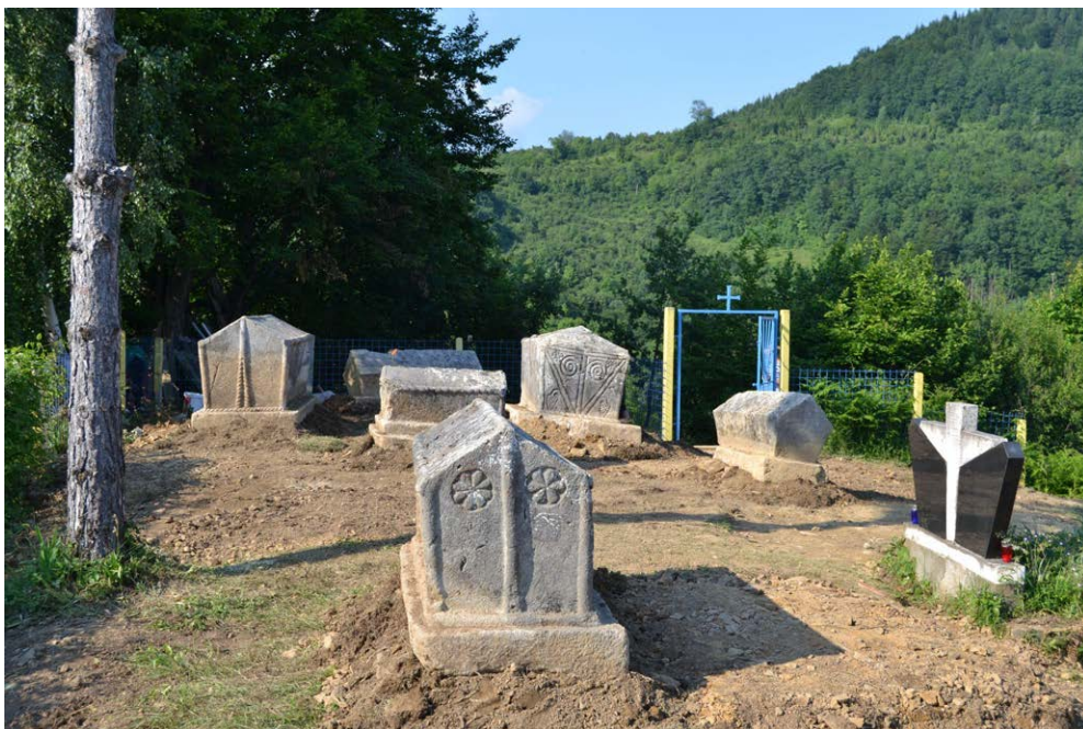
Slika 7. Pogled na stećke na nekropoli Kopošići

U razdoblju od 16. juna do 1. jula 2015. godine, tim arheologa Filozofskog fakulteta u Sarajevu obavio je iskopavanja na ovom groblju. Cilj je bio provjeriti razinu uništavanja nekropole u ranijim periodima te način sahranjivanja ispod ovih značajnih spomenika. Na centralnom dijelu nekropole, na manjem uzvišenju, nalazi se osam najznačajnijih stećaka. Sedam ih je pomjereno te su istraženi grobovi ispod njih. Istraživanja su otkrila da je stećak velikog kneza bosanskog Batića (br. 1) ranije pljačkan. Pronađen je samo jedan željezni čavao i fragment bedrene kosti, što ukazuje na njegovo potpuno uništenje. Stećak (br. 2) koji se veže u tradiciji uz Batićevu suprugu Vukavu je također opljačkan, a pljačkaši su ušli sa strane, bez pomjeranja stećka. Pronađena je grobna konstrukcija od kamenih ploča. Grob ispod dječijeg stećka (br. 3) je također bio prekopan, a pronadna su samo tri čavla, što ukazuje na ukop u drvenom sanduku. Ispod stećka br. 4 pronadn je fragmentirani skelet u drvenom sanduku s malim ostacima brokatne tkanine u predjelu glave, najvjerojatnije od kape. U grobu ispod stećka br. 5 otkriven je dobro očuvan drveni poklopac masivnog sanduka napravljenog od hrastovine, s malim ostacima brokatne tkanine oko glave pokojnika. Ostaci skeleta su skoro u potpunosti propali. Ispod stećka br. 6 pronadn je kompletan skelet sa tragovima posipanja krečom. Ukop je