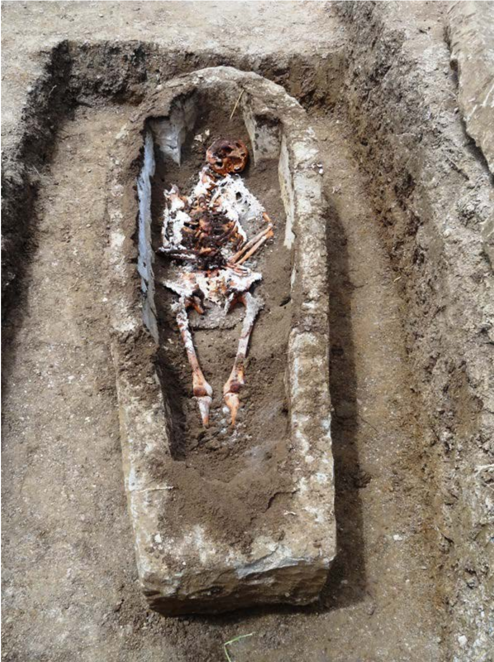
Slika 11. Sarkofag otkriven prilikom istraživanja na Glavici

Antropološkom analizom skeletnih ostataka utvrđeno je da su sahranjivane odrasle osobe i djeca. Među značajnim nalazima je skelet muškarca starosti 35–45 godina sa zabilježenom povredom na zatiljnom dijelu lubanje, nanesenom tupim predmetom, što je vjerojatno uzrok smrti. Na drugom muškom