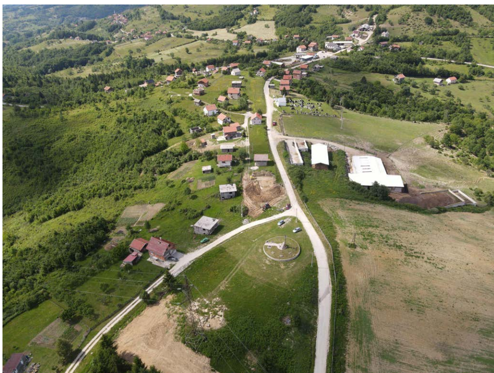
Slika 3. Pogled na lokalitet Ovnak u toku istraživanja 2021. godine

Uz navedenu istraženu humku, nalazile su se još dvije, najvjerojatnije recentnije prirode 10 te je ovom prilikom istražena i jedna od njih. Osim nekoliko fragmenata stećaka u sekundarnom položaju, grobova nije bilo. Također, u neposrednoj blizini je pronađeno još nekoliko dijelova stećaka koji vjerovatno svi potiču sa humke unutar koje su pronađeni grobovi.