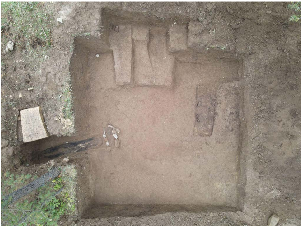
Slika 10. Markov kamen prilikom istraživanja

govore narodne predaje, s ciljem daljnjeg iskorištavanja u turističke, naučne i obrazovne svrhe. Markov kamen nije registriran u Arheološkom leksikonu BiH niti je obrađen u radovima Š. Bešlagića. Iskopavanja su provedena u periodu od sedam radnih dana, od 10. do 16. oktobra 2020. godine. Otvorena je jedna sonda na vještački formiranoj humci, koja je proširena na ukupnu površinu od 38 m 2 . Unutar istražene površine evidentirano je i dokumentirano ukupno 7 grobova.