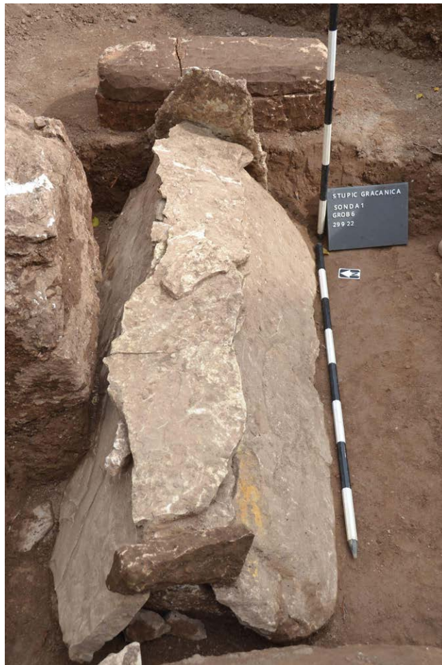
Slika 5. Konstrukcija "na dvije vode" sa lokaliteta Stupić u Bugojnu

Istraživanja su zabilježila tri tipa grobnih konstrukcija, i to tri ukopa u kamenim sarkofazima, što je najkompleksniji i najmonumentalniji tip sahranjivanja. Tri ukopa su bila u grobovima s kamenom konstrukcijom u obliku krova na dvije vode, što predstavlja relativno rijetku formu grobnice. Jedan ukop je bio u jednostavnoj zemljanoj raki što je najjednostavniji i najčešći način sahranjivanja u grobljima kasnog srednjeg vijeka na prostoru srednje Bosne.