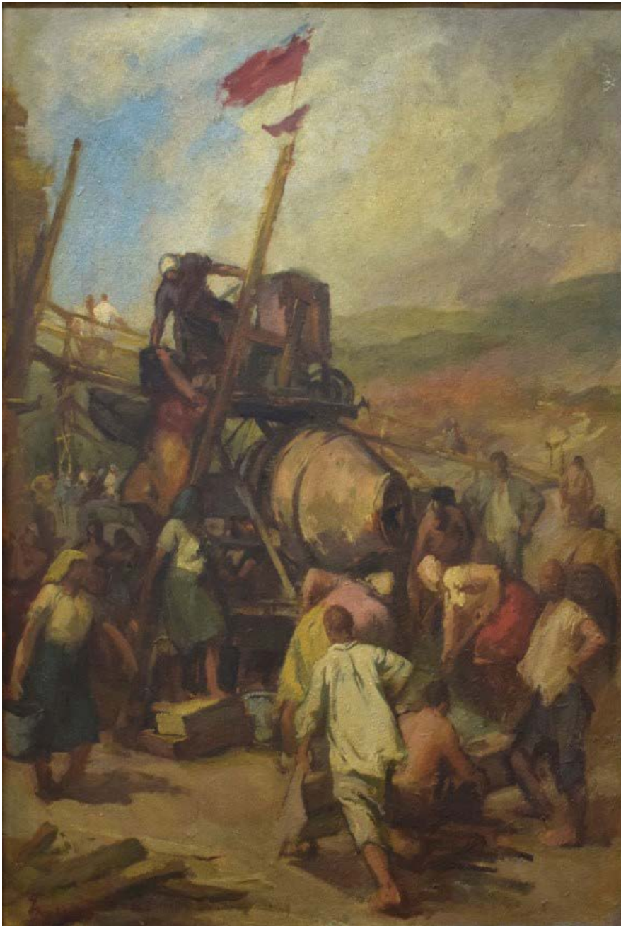
Slika 2: Ismet Mujezinović