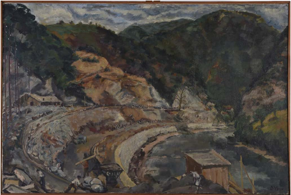
Slika 1: Vojo Dimitrijević