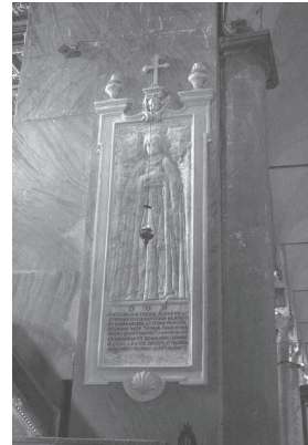
Slika 7: Kraljičina nadgrobna ploča u rimskoj bazilici Santa Maria in Aracoeli