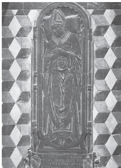
Slika 10: Donatello, Nadgrobni spomenik Giovannija Peccija