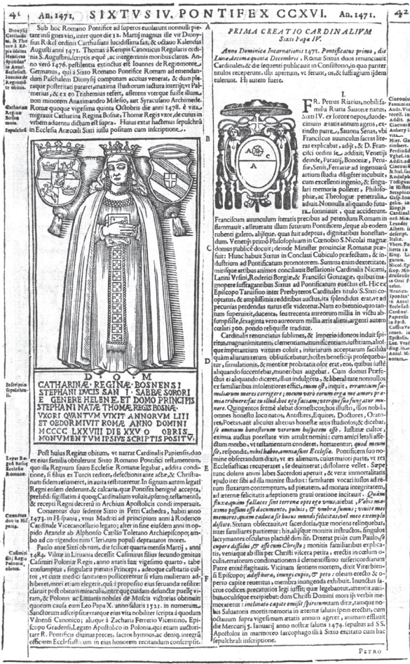
Slika 8: Bakrorez nepoznatog umjetnika odnosno najstarija dosad poznata reprodukcija kraljičine nadgrobne ploče objavljena je 1677. godine u djelu Alphonsusa Ciaconniusa.