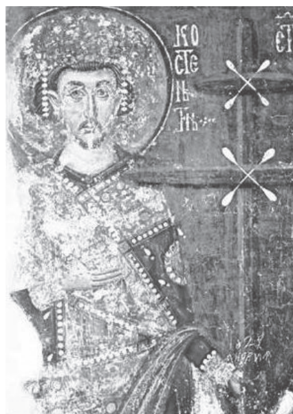
Slika 5: Konstantin Veliki freska iz samostana Mileševa