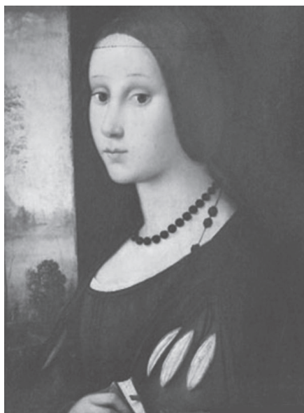
Slika 2: Portret mlade djevojke iz rimske Kapitolske galerije