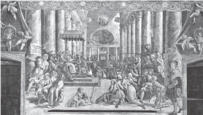
Slika 6: Freska “Konstantinova darovnica rimskom papi Silvestru I. i njegovim nasljednicima” u vatikanskoj dvorani cara Konstantina Velikog