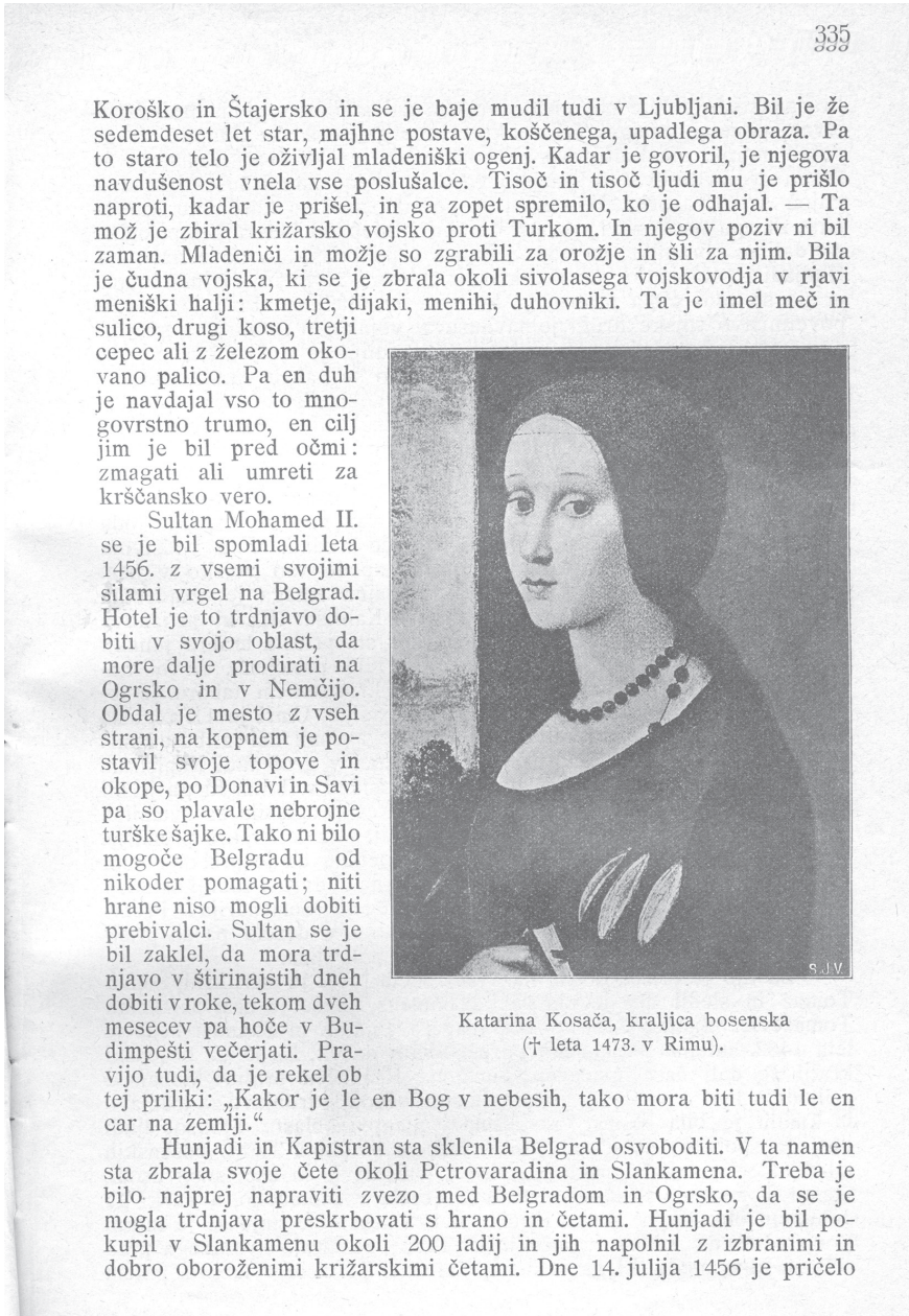
Slika 1: Portret mlade djevojke iz rimske Kapitolinske galerije u knjizi slovenač kog historičara Josipa Grudena

tonio del Pollaiuolo (1432?-1498). 24 U svakom slučaju kraljičina nadgrobna ploča zahtijeva dosta opsežnu znanstvenu raspravu.